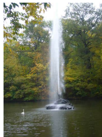
Краса створена людськими руками...