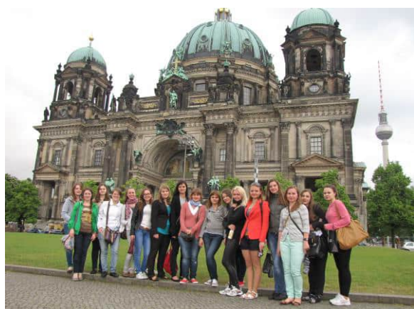
Берлін зустрічає нас дощем