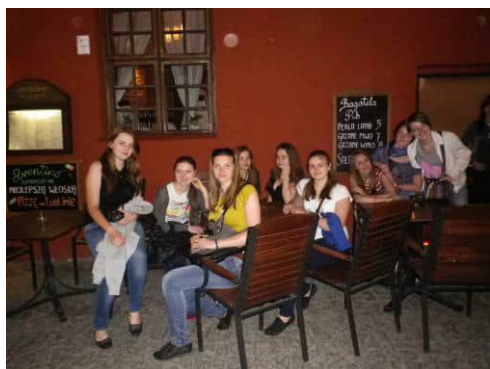
Нічний Люблін зачаровує...