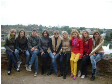
Осінь дивує своїми барвами...