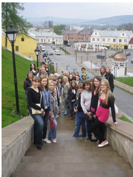
Чудове місто і гарне товариство