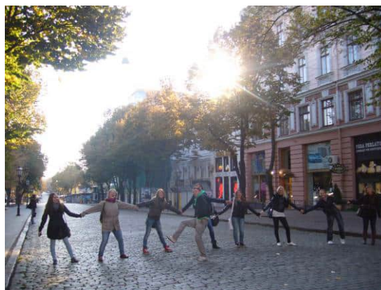
6.00 ранку і все місто для нас!