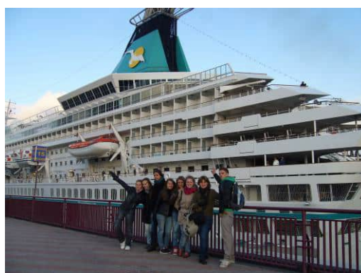
Коли одна ніч у поїзді і цілий день у нашому розпорядженні щоб погуляти по прекрасній Одесі