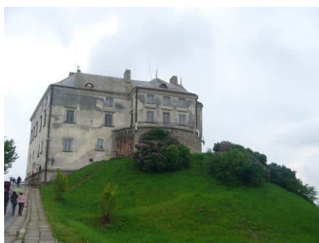
Коли Олеський замок по дорозі.....