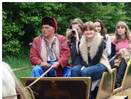
Пізнаємо не лише архітектурну спадщину, але й і духовну....