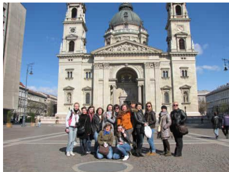
Коли навіть погода сприяє чудовому вікенду