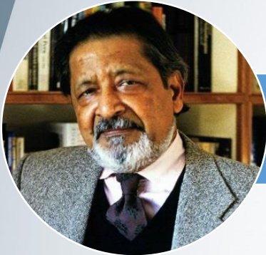
Відьядер С. НАЙПОЛ (1932-2018)