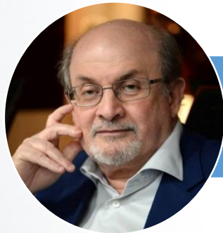
Салман РУШДІ (1947)