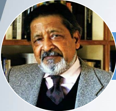
Відьядер С. НАЙПОЛ (1932-2018)