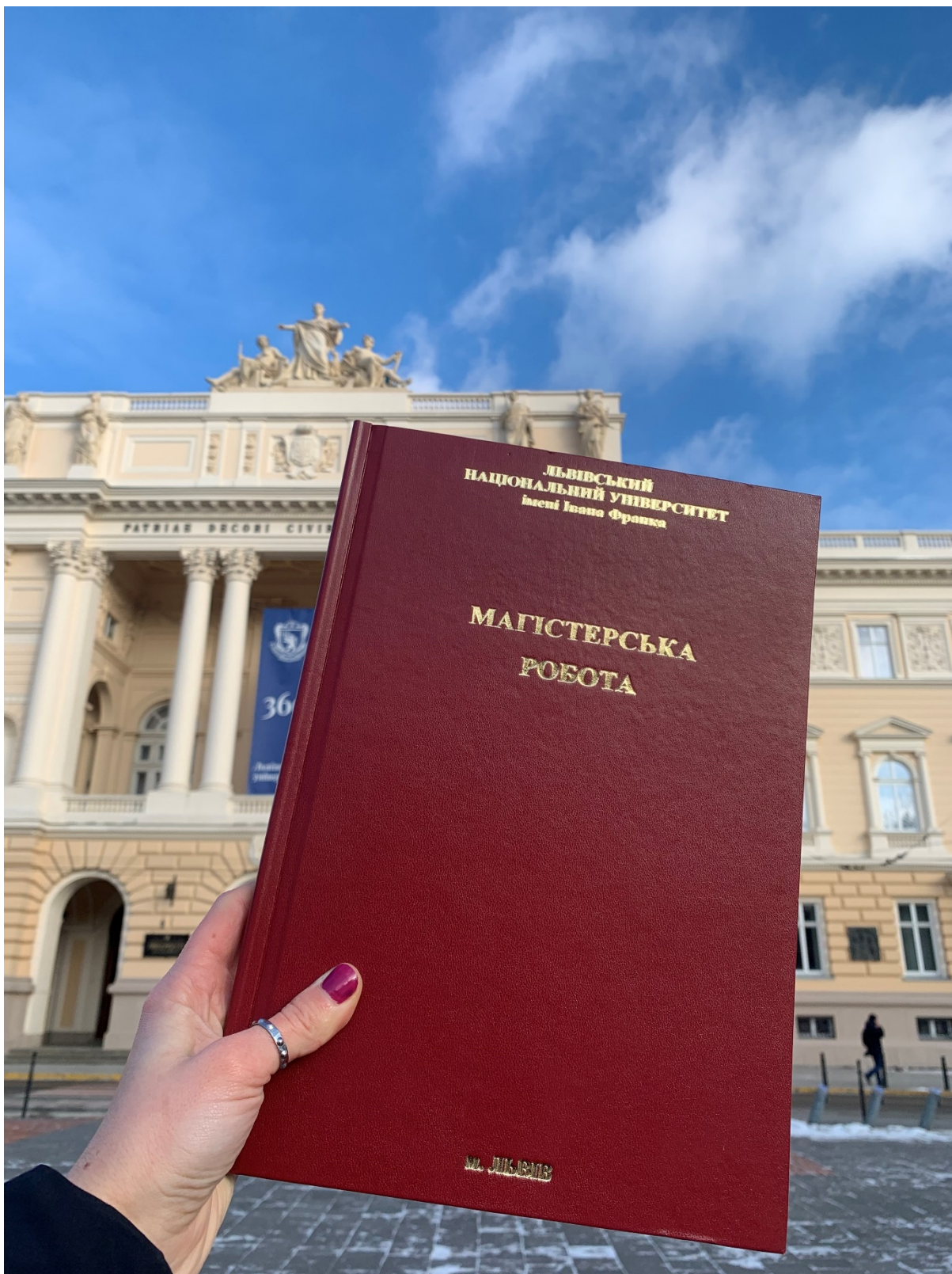
Фото Олени Мохун, магістрантка 2021 року.